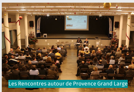
Les Rencontres autour de Provence Grand Large