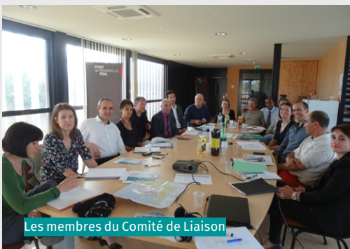
Les membres du Comité de Liaison

www.provencegrandlarge.fr pour retrouver les actualités du projet, les rendez-vous, et prolonger la participation du public pendant la phase de concertation préalable.